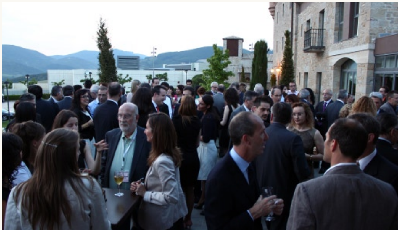
Cena de Clausura en el Hotel Castillo de Gorraiz