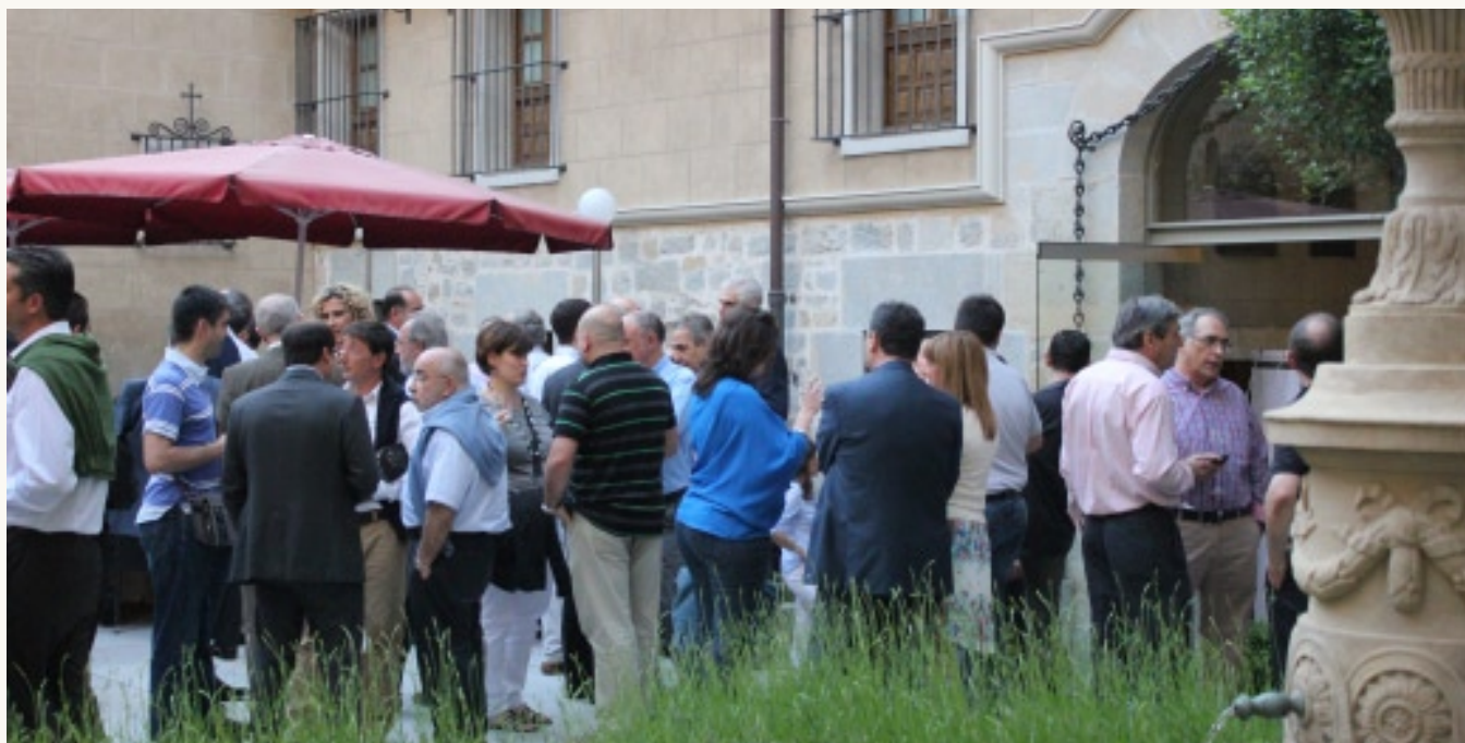
Cóctel de Bienvenida en el Hotel Palacio de Guendulain

En otros aspectos el Cocktail de Bienvenida que tuvo lugar en el Palacio de Guendulain fue muy concurrido y en su magnífico patio pudimos departir con colegas de todo el país, a muchos de los cuales hacia tiempo que no los veíamos.