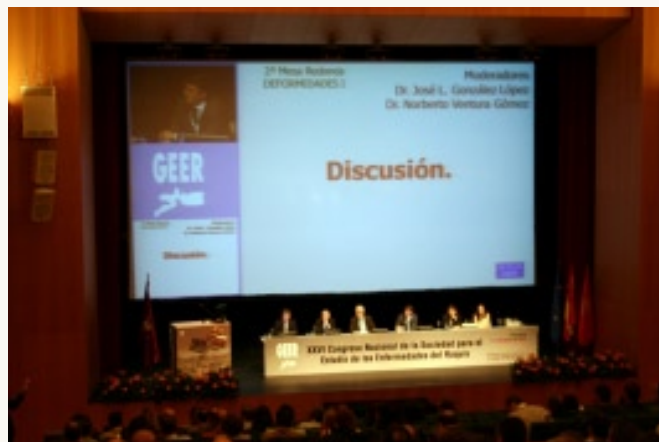
Sala Plenaria del Congreso

Para el acto inaugural hemos contado con la presencia de la presidenta del Gobierno Excm. Sra Yolanda Barcina y de la consejera