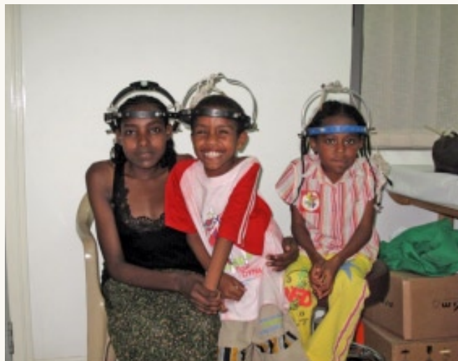
Pacientes preparados para la tracción esquelética

otra parte cada año se celebra en Nueva York una cena de gala para captar fondos para la Fundación. Hasta la fecha unos 1.200 donantes han contribuido con una cantidad aproximada de 10 millones de dólares.